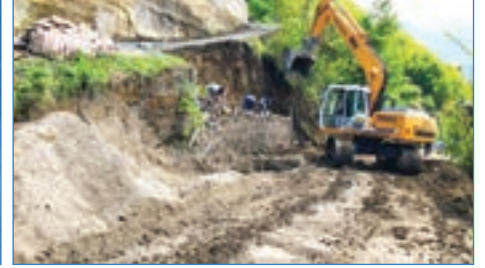
➤ Adacık Mh. Esentepe mevki 132 m 3 taş-duvar yapımı