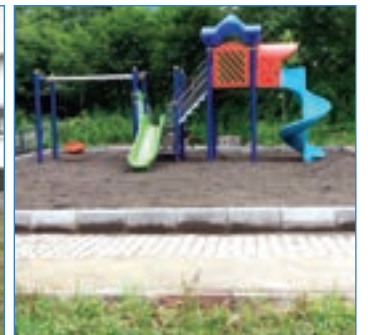
➤ Akçaköy Mahallesi