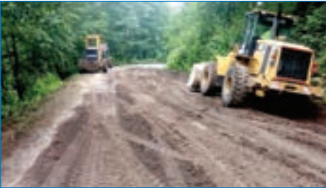
➤ Demirci-Özdemirci bağlantı yolu malzemeli yol bakımı çalışması