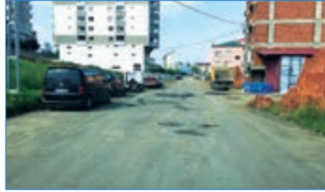
➤ Yaylacık Mah. Dört Yol Sanayi Camii yolu asfalt tamiri çalışması