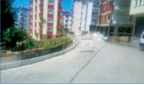
➤ Yaylacık Mahallesi Varlık Sokak tretüvar çalışması