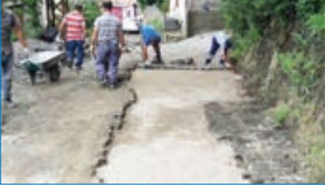
➤ Çolaklı Mh. Mera Sk. parke tamirata çalışması