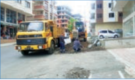
➤ Yaylacık Mahallesi Akçaabat Caddesi tretüvar çalışması