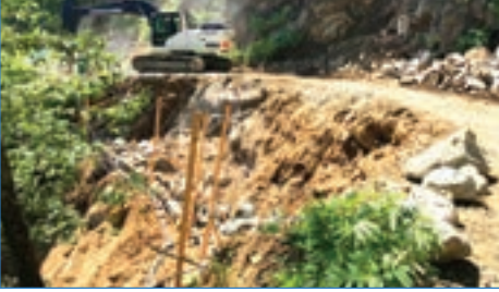
➤ Acısu Mh. 180 m 3 taş duvar

Fen İşleri Müdürlüğü ekiplerince yol yapım, bakım ve genişletme çalışmaları aralıksız devam ederken çalışmalar sırasında zeminin kaymasını önlemek amacıyla da istinat duvarları inşa ediyor. Muhtemel toprak kaymalarını önleyerek vatandaşların can ve mal güvenliğini sağlamak amacıyla mahallelerde gerçekleştirilen istinat duvarı yapım çalışmalarında güvenlik ön planda tutuluyor.