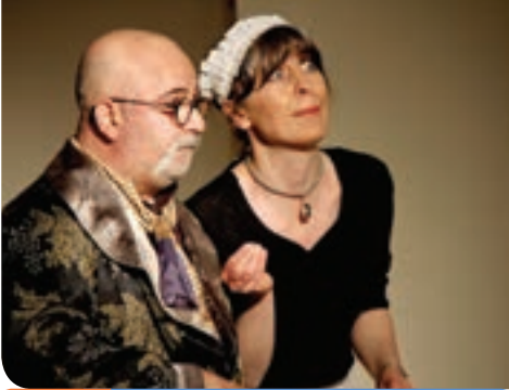
7. Gün Trabzon Mizah Sanatı Derneği