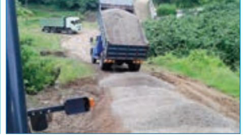
➤ Demirci-Özdemirci bağlantı yolu malzemeli yol bakımı çalışması