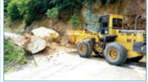
➤ Fındıklı Mahallesi heyelan kaldırma çalışması