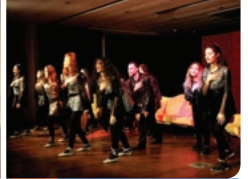
9. Gün KTÜ Tiyatro Kulübü