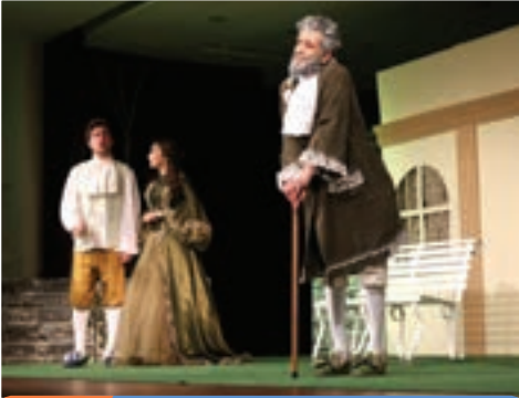
4. Gün Giresun Belediye Şehir Tiyatrosu