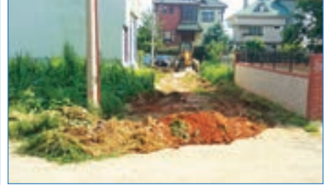
➤ Söğütlü Mahallesi Yasemin ve Papatya Sk. malzemeli yol bakım çalışması