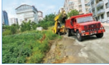
➤ Söğütlü Mahallesi Konakaltı Sk. yol temizliği çalışması