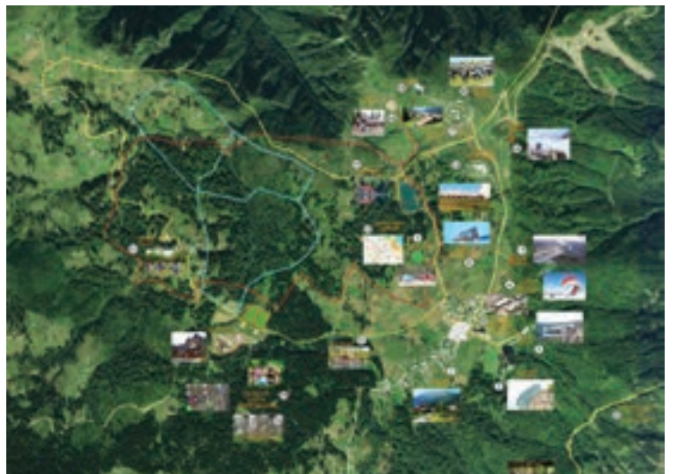
Hıdırnebi Yaylası Turizm Projesi

Akçaabat'tan Söğütlü deresi boyunca giden tarihi bir ticaret yolunun varlığı, bu yolun Aykut'ta ikiye ayrıldığı ve iki kol halinde Torul'dan ana İpek Yolu'na bağlandığı yöreyi inceleyen tarihçiler tarafından kabul edilmektedir. Bu kapsamda Akçaabat, Düzköy, Honefter Yaylası, Zigana güzergahından Torul'a bağlanan bir kervan yolunun varlığı ile Aykut, Gökçeler, Taşocağı, Çal, Çayırbağı üzerinden Fol, Karaçam-Torul güzergahı üzerinde kale ve gözetleme yerlerinin olduğu ifade edilmektedir.