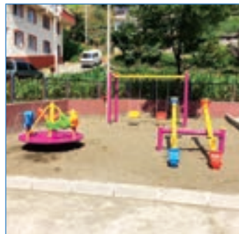
➤ Kavaklı Mahallesi