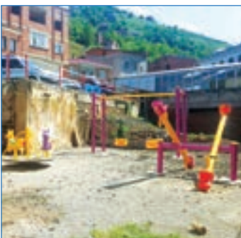
➤ Işıklar Mahallesi

Akçaabat'taki mahallelerin çehresini değiştirmek, güzelleştirmek ve çocuklar için yeni oyun alanları yaratmak amacı ile çalışmalarını aralıksız sürdürdüklerini belirten Akçaabat Belediye Başkanı Şefik Türkmen; “İlçe genelinde çocuk parklarının sayısını arttırmaya devam ediyoruz. Aynı zamanda parkların çevresinde yapılan yeşillendirme ve düzenleme çalışmaları ile parklar hem güzel görünüm kazanıyor hem de parkları yetişkinler çocuklarıyla birlikte zaman geçirebilecekleri yerler haline getiriyoruz.” dedi.