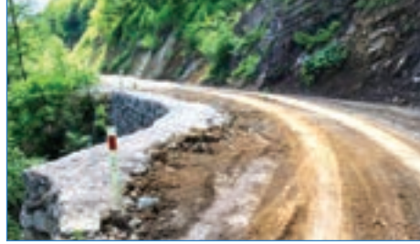
➤ Acısu Mh. 180 m 3 taş duvar