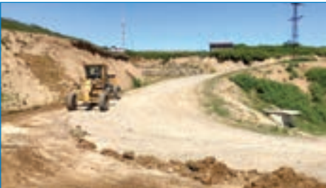
➤ Hıdırnebi kaya altı beton öncesi yol temizliği çalışması