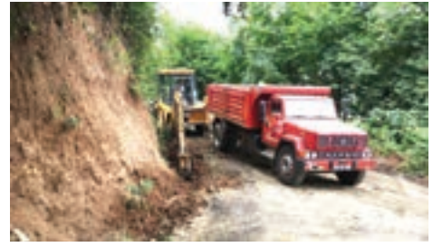
➤ Fındıklı Mh. Esentepe Mh. yolu asfalt öncesi yol kanava temizliği çalışması