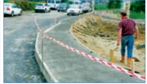
➤ Yaylacık Mahallesi Başaran Sokak 114 mt. tretüvar çalışması