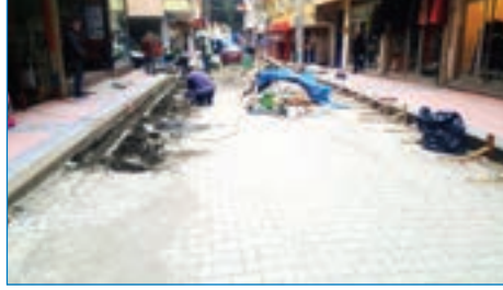
➤ Dürbinar Mah. Çimenli Sk. 160 mt. tretuvar çalışması