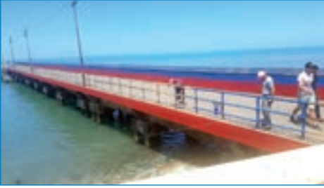
➤ Akçaabat iskelesi boya çalışması

Akçaabat Belediyesi Fen İşleri müdürlüğü ekipleri mahalleleri tek tek tarayarak ilçenin dört bir yanında sürdürdüğü hizmet seferberliğinde dur durak bilmiyor.