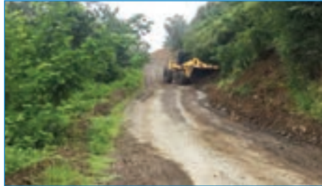
➤ Akçakale Mh. Barış Cd. yol heyelan temizliği çalışması