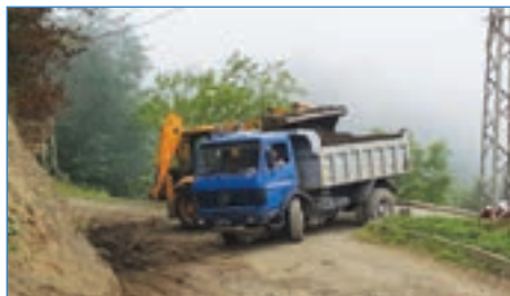
➤ Karaçayır Mahallesi yol bakım çalışması