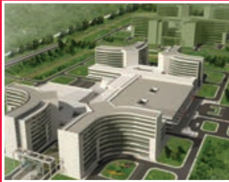
Şehir Hastanesi Akyazı'ya. Sayfa 4'de