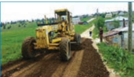
➤ Işıklar Mahallesi Kayabaşı Yaylası yol temizliği ve dağ malzemesi serme çalışması