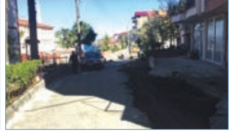
➤ Mersin Mahallesi Sahil Caddesi yol temizliği ve parke tamiratları çalışması