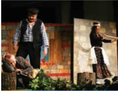
5. Gün Trabzon Şehir Tiyatrosu