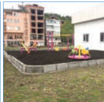
➤ Akçakale Mahallesi