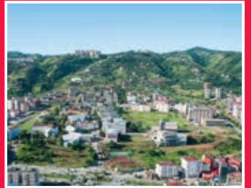
Trabzon Günleri'nde Akçaabat Farkı. Sayfa 6'da