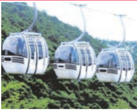
Teleferik Projesi Başlıyor. Sayfa 3'de