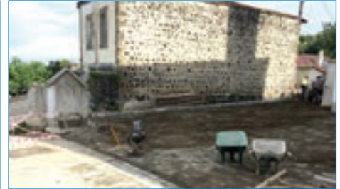
➤ Çolaklı Mh. Cami önü 170metre kare parke çalışması