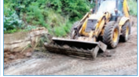
➤ Derecik Mahallesi Yolbaşı Mevki malzemeli yol bakımı çalışması