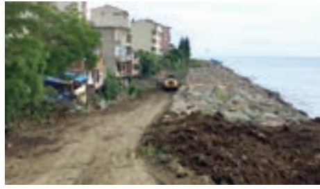
➤ Darıca sahil tahkimat arkası dolgu yapılıyor