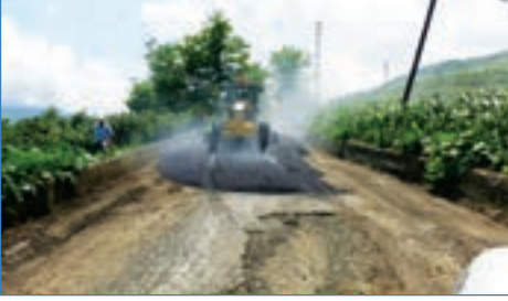
➤ Şinik Mahallesi Fatih Caddesi sıcak asfalt serildi