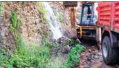
➤ Fındıklı Mahallesi tıkanan büz ağızları açıldı