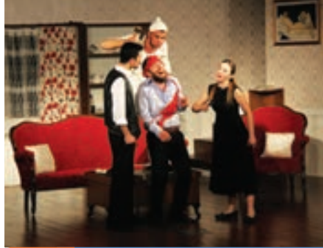
8. Gün Eskişehir Midas Sanat Tiyatrosu