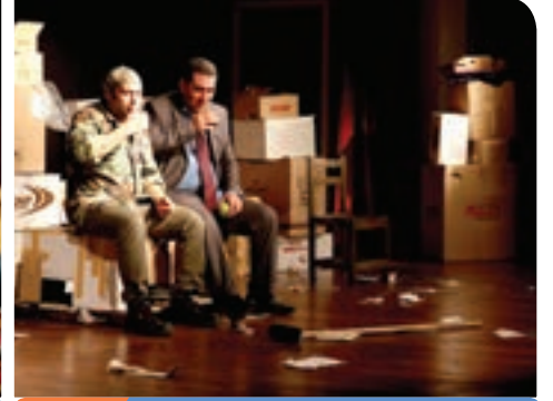
3. Gün Erzurum Medya Sanat Evi