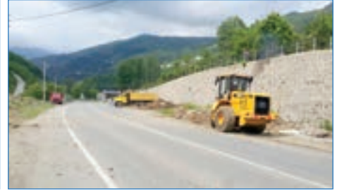
➤ Yıldızlı Mahallesi Seragözü Cad. yol kenarı temizliği çalışması