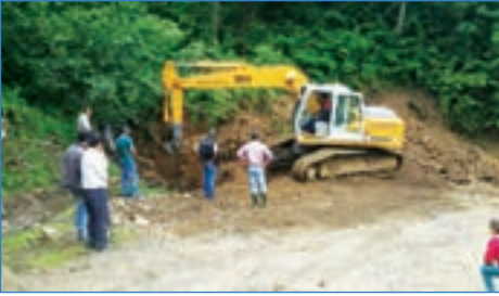
➤ Uçarsu Mahallesi Çamlıca yolu menfez ağızı çalışması