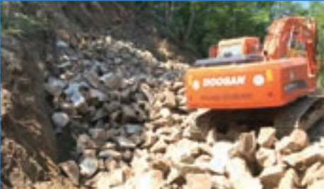
➤ Adacık Mh. 123 m 3 taş duvar taşı kırılıyor