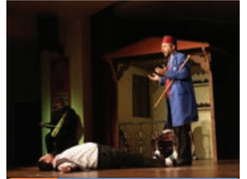
6. Gün Ordu Büyükşehir Belediyesi Karadeniz Tiyatrosu