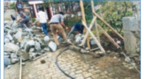
➤ Ortamahalle Sirt Sk. 26 m 3 taş duvar