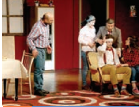
2. Gün Trabzon Sanat Tiyatrosu