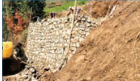
➤ Derecik Mh. Uğurlu mevki 114 m 3 taş duvar