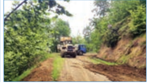
➤ Adacık Mh. Esentepe Cd. yol tarama ve temizliği çalışması