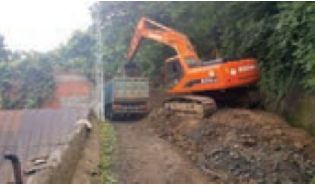
➤ Çamlıca Mah. yol genişletme çalışması