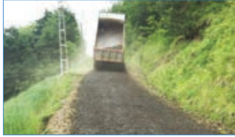
➤ Adacık Mh. Bahar Sk. yol malzemesi serildi