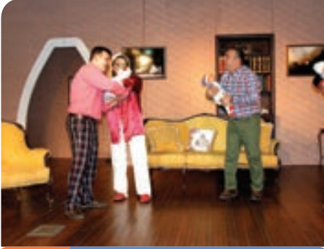
1. Gün Akçaabat Belediye Tiyatrosu

Kurulduğu günden bu yana çalışmalarını amatör ruh ile sürdürmekte olan ve tiyatro sevgisini halk ile bütünleşerek anlatma gayesindeki Akçaabat Belediye Tiyatrosu, Trabzon Sanat Tiyatrosu, Erzurum Medya Sanat Evi, Giresun Belediye Şehir Tiyatrosu, Trabzon Şehir Tiyatrosu, Ordu Büyükşehir Belediyesi Karadeniz Tiyatrosu, Trabzon Mizah Sanatı Derneği, Eskişehir Midas Sanat Tiyatrosu ve KTÜ Tiyatro Kulübü gruplarının da yer aldığı " Erol Günaydın Tiyatro Günleri "nde 9 gün boyunca her akşam bir oyun sahnelenerek 3 bin 500 kişi izleyici kitlesine ulaşıldı.