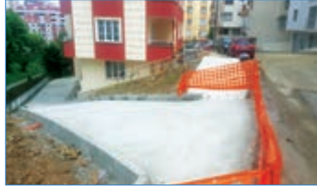
➤ Yaylacık Mahallesi Varlık Sokak tretüvar ve yol beton çalışması