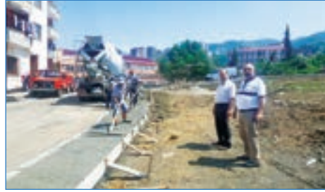
➤ Yaylacık Mahallesi Başaran Sokak 114 mt. tretüvar çalışması