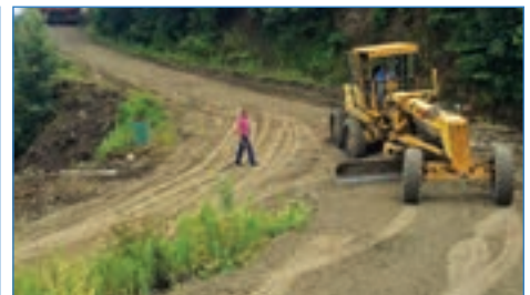
➤ Mersin Mah. Kuru Küme Evleri malzemeli yol serildi