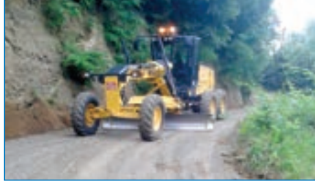
➤ Demirci-Özdemirci bağlantı yolu malzemeli yol bakımı çalışması