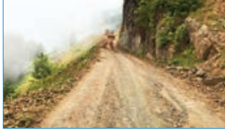
➤ Hıdırnebi kaya altı beton öncesi yol temizliği çalışması