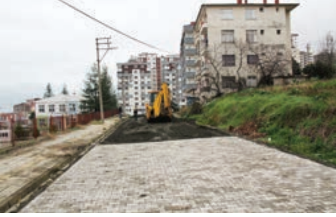
Söğütlü Mahallesi Çınar Sokak, Söğütlü İlkokulu arkasında 150 metre uzunluğundaki yolun parke kaplaması yapıldı.