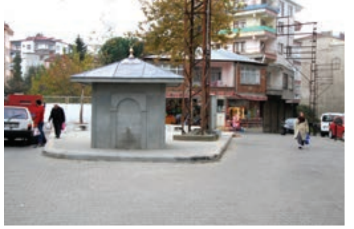
Dürbinar Mahallesi Harman Mevkii Park ve Çeşme Düzenlemesi