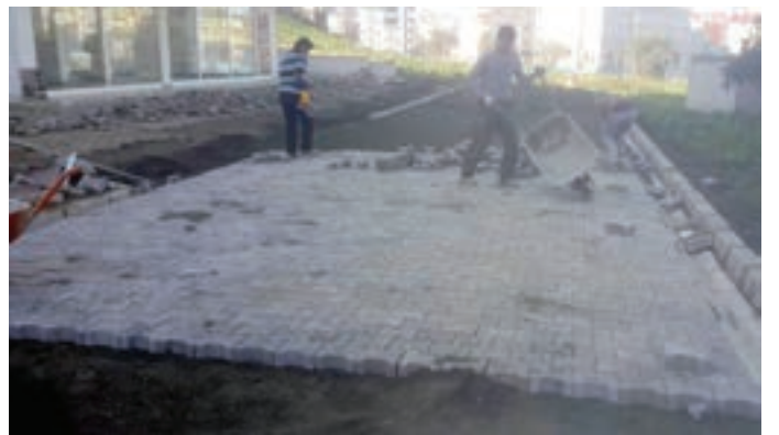
Söğütlü Mahallesi Uğurlu Sokak parke yapım çalışması tamamlandı.