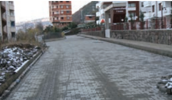
Yıldızlı Mahallesi Mutlu Sokak bağlantı kısmında yeni açılan sokağa 100 metre parke döşendi.