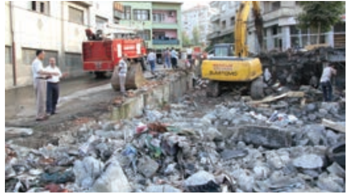
Sarıtaş-TOKİ yolu girişindeki binaların yıkılmadan önceki durumu