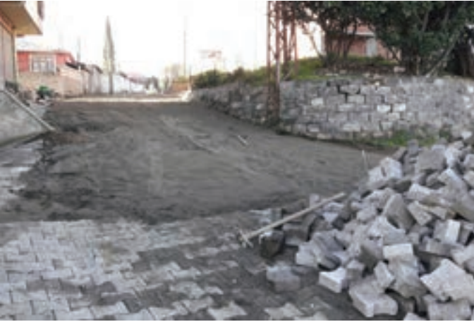
Yaylacık Mahallesi Güven Sokak'ta bozulan parkeler yeniden yapıldı.