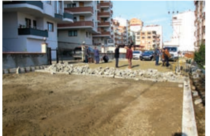
Çolaklı Mahallesi, Güneşli Sokak'ta 200 metre uzunluğundaki yol düzenlenerek parke kaplaması yapıldı ve hizmete açıldı.