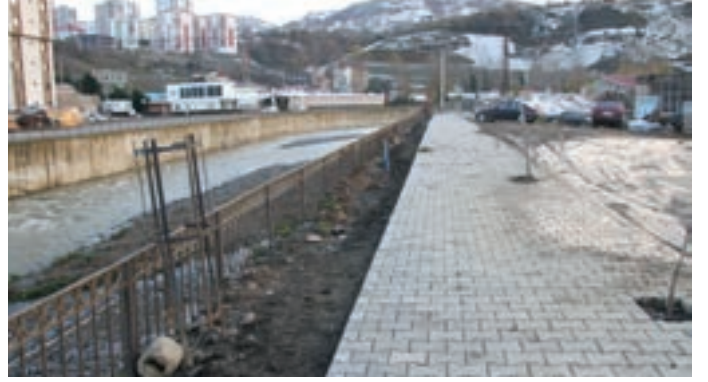
Söğütlü Deresinin her iki tarafına Devlet Karayolundan güneye doğru yürüyüş yolu, yaya kaldırımı ve ağaçlandırma çalışması yapıldı.