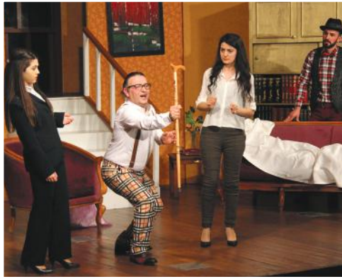
5. Gün Akçaabat Belediye Tiyatrosu