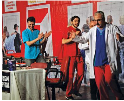
2. Gün Hamsimedya Prodüksiyon