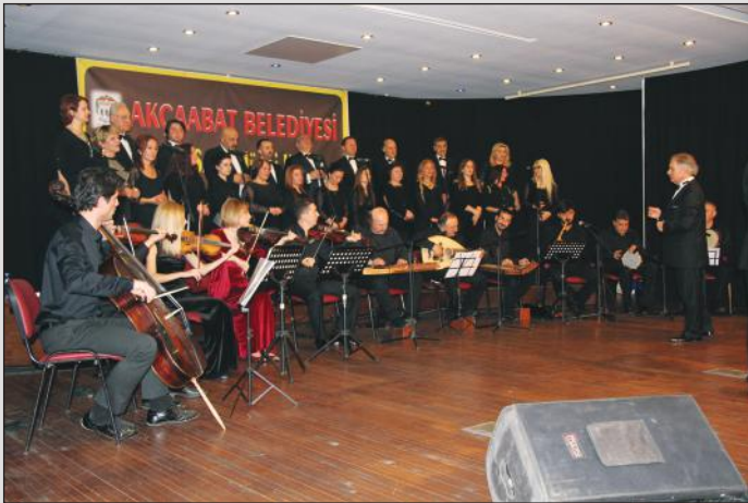
Belediye Türk Sanat Müziği Korusu

1996 yılında kurulan Akçaabat Belediyesi TSM korusu ve 2001 yılında kurulan THM korusu ilçemizde ve diğer il ve ilçelerde konserler vererek şehrin tanıtımına büyük katkı sağlamaya devam ediyor.