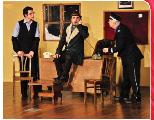
3. Gün Trabzon Büyükşehir Tiyatrosu