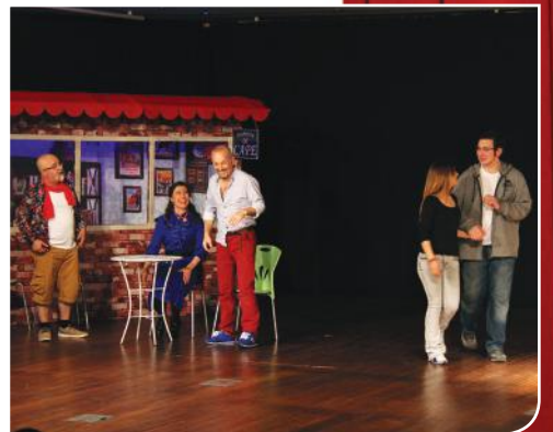
9. Gün Trabzon Mizah Sanatı Derneği Tiyatrosu