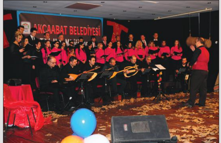
Belediye Türk Halk Müziği Korusu