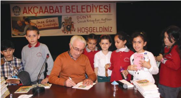
Çocuk kitapları yazarı Aziz Sivaslıoğlu Akçaabat'ta çocuklarla söyleşi yaptı ve kendi kitaplarını imzalıyarak çocuklara hediye etti.

Dünya Çocuk Kitapları Haftası kapsamında mahalle okullarında ücretsiz kitap dağıtımını yaptı.