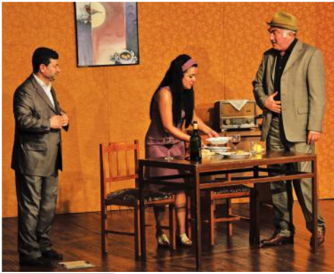
4. Gün Trabzon Sanat Tiyatrosu