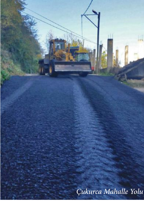
Çukurca Mahalle Yolu

Akcaabat Belediyesi Fen İşleri Müdürlüğü'nce mahallelerde asfaltlama çalışmalarına devam ediliyor.