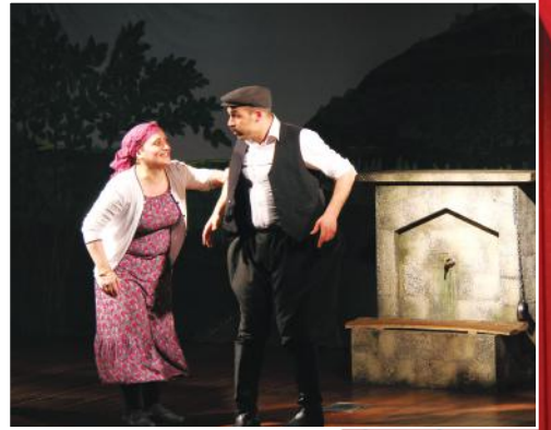
6. Gün Ünye Sanat Tiyatrosu