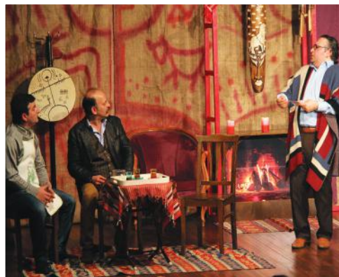
8. Gün Umut Tiyatrosu