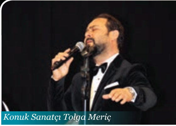
Konuk Sanatçı Tolga Meriç