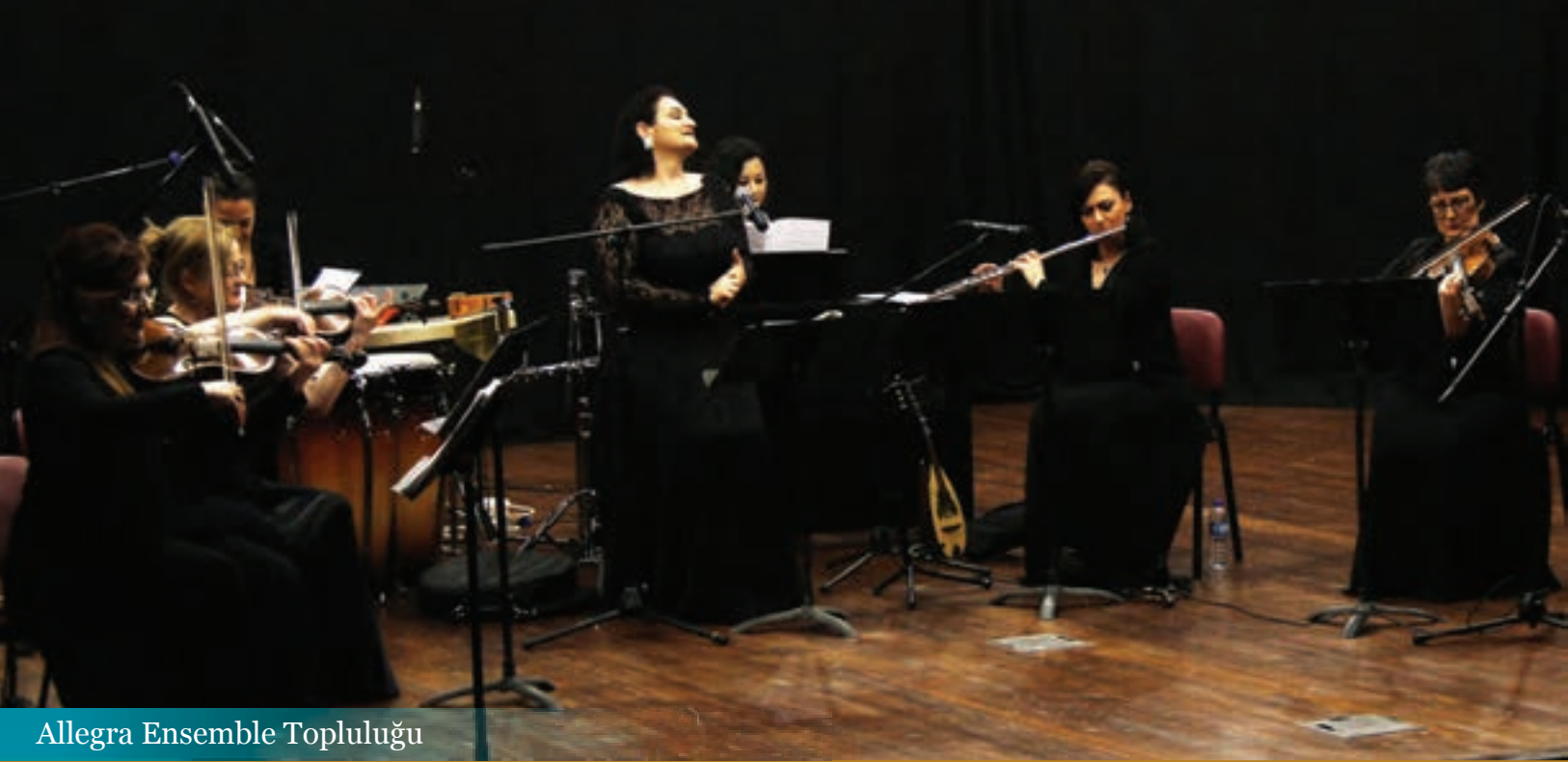
Allegra Ensemble Topluluğu

Kültür ve Turizm Bakanlığı Devlet Opera ve Balesi (DOB) Genel Müdürlüğü tarafından düzenlenen ve Akçaabat Belediyesi'nin de desteklediği 3. Trabzon Opera ve Bale Günleri yapıldı.