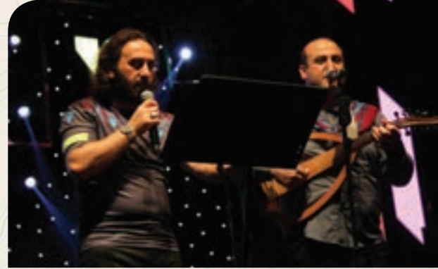
Akçaabatlı Sanatçılar Grubu

Trabzonspor'a katkı sağlamak için "Bordo-Mavi" konseptiyle gerçekleştirilen etkinliğe; Trabzon Milletvekilleri Adnan Günnar ve Bahar Ayvazoğlu'da katıldı. Ayrıca Trabzonspor formasıyla katılanlar, festival alanını Bordo-Mavi renklere bürüdüler. Formasını alıp gelenlere Akçaabat Belediyesi tarafından Bordo-Mavi ve Türk Bayrakları dağıtıldı.