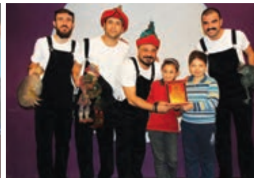
Trabzon Büyükşehir Çocuk Tiyatrosu