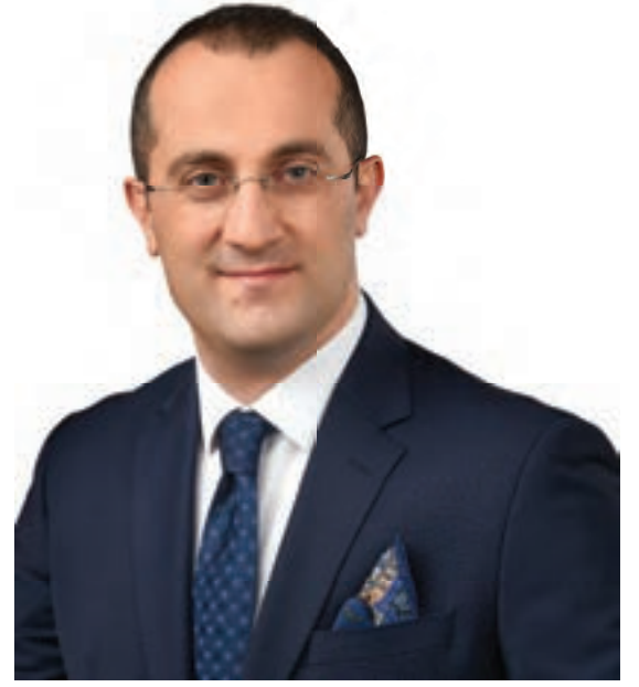
Osman Nuri EKİM Akçaabat Belediye Başkanı

Bu anlamda; tüm hemşehrilerimizden Akçaabat'ımızın kültür, sanat ve turizm şehri yolunda markalaşması hedefimize katkı vermek için bu faaliyetlerimize katılmalarını istiyoruz.