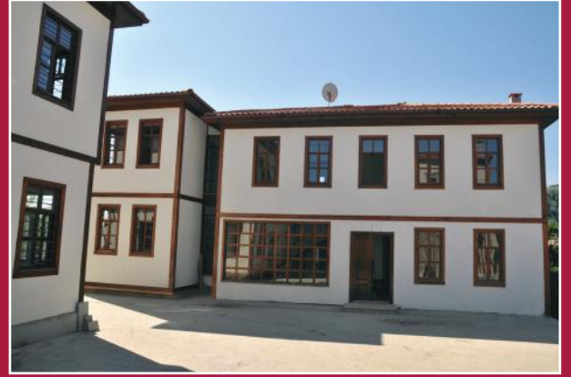
Restorasyonu tamamlanan 2.tesis