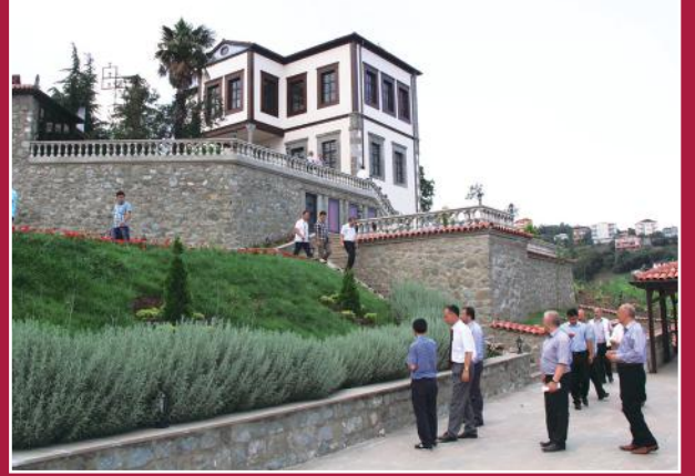
Restorasyonu tamamlanan 1.tesis: Timurciler Konağı