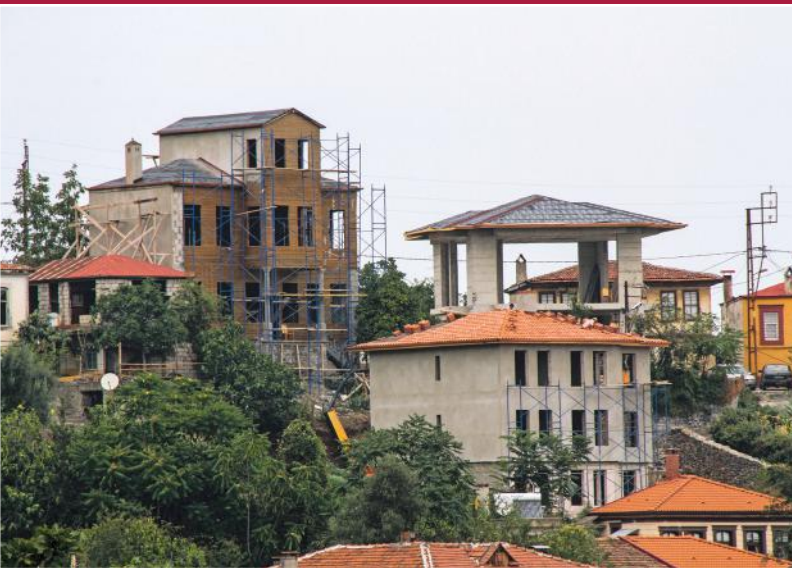
Restorasyonu devam eden 3.tesis